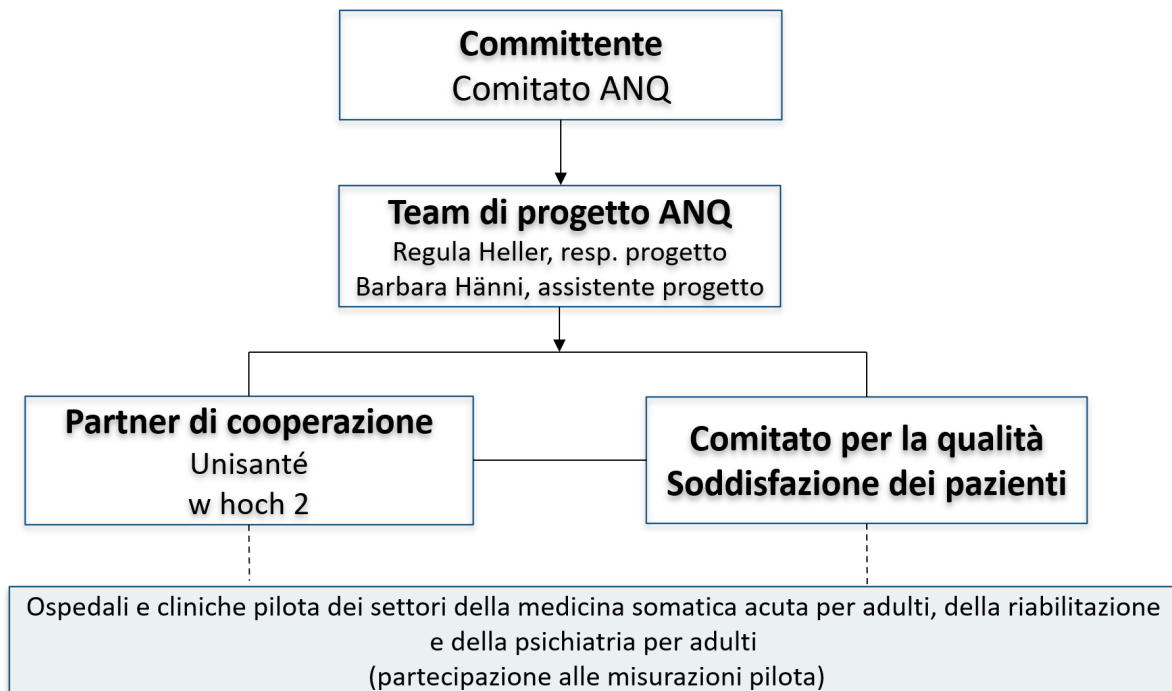
Figura 2: organizzazione del progetto